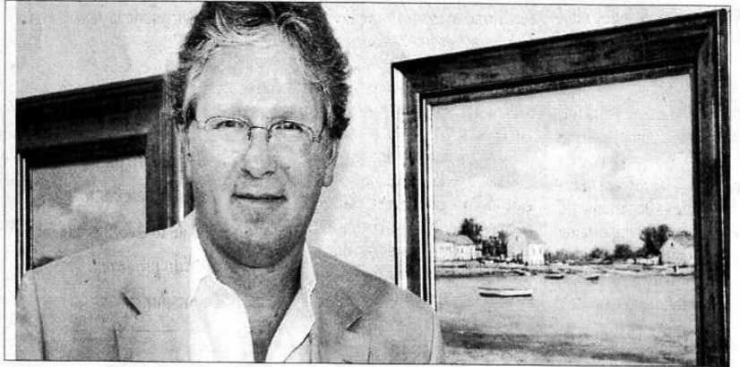
El pintor argentino expone sus cuadros por primera vez en Galicia.

Su obra se puede encontrar colgada en las mejores colecciones privadas de Estados Unidos, Francia, Reino Unido, Israel y de varios países latinoamericanos. En todos sus cuadros el paisaje habitado es el protagonista absoluto. Una opción que asegura que llegó por su interés "en cómo se funde el hombre con su entorno y como cambia el paisaje según la cultura en la que nos encontramos". En el caso de las Rías Baixas ha encontrado "el encanto de las barcas" y la seducción "de los diferentes verdes que tanto