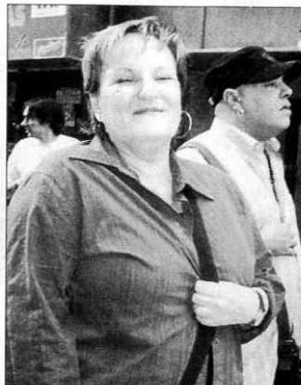
Porteiro, a Madrid.

A sentado en la Illa da Arousa y después de haber adquirido todo lo necesario para su casa en Vigo (tal y como les adelantábamos en este periódico) y pagado a tocateja, el ministro de Fomento, José Blanco disfruta de la playa en bañador, como un turista más. El domingo por la tarde sin ir más lejos, paseaba en traje de baño rojo, acompañado por otros dos hombres, de bañador negro y que podrían ser sus guardaespaldas, supongo sin certeza alguna. Lo que sí tengo claro es que ninguno de ellos (los hombres del bañador negro) era Abel Caballero , que últimamente comparte muchos momentos de cafés, paseos y comidas con el ministro, desde que éste regresó a Galicia por vacaciones.