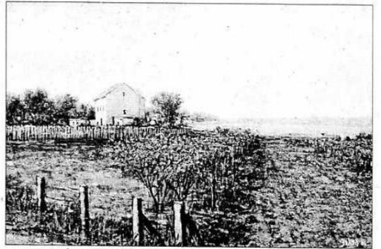
Uno de los cuadros inspirados en los paisajes gallegos.

Su fascinación por Galicia también quedó patente en una de sus últimas exposiciones en Buenos Aires, donde de las veintisiete telas colgadas, diez tenían temática gallega, ya que siempre que visita un lugar le acompañan sus pinceles "y recojo ideas que después plasmo en mis trabajos. Por ejemplo, ahora quiero sacar algún tiempo para tomar apuntes, porque a cada lado que miro estoy viendo un cuadro".