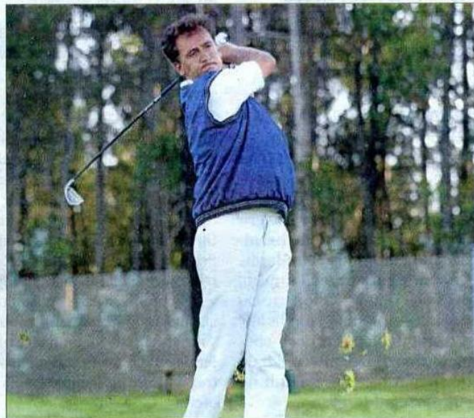
El actor Francis Lorenzo demostrando su estilo con el golf