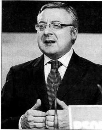
El ministro en bañador.

A sentado en la Illa da Arousa y después de haber adquirido todo lo necesario para su casa en Vigo (tal y como les adelantábamos en este periódico) y pagado a tocateja, el ministro de Fomento, José Blanco disfruta de la playa en bañador, como un turista más. El domingo por la tarde sin ir más lejos, paseaba en traje de baño rojo, acompañado por otros dos hombres, de bañador negro y que podrían ser sus guardaespaldas, supongo sin certeza alguna. Lo que sí tengo claro es que ninguno de ellos (los hombres del bañador negro) era Abel Caballero , que últimamente comparte muchos momentos de cafés, paseos y comidas con el ministro, desde que éste regresó a Galicia por vacaciones.